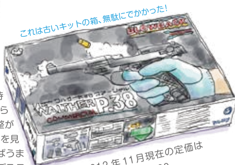
これは古いキットの箱、無駄にでかかった!

2012年11月現在の定価は 完成品が ¥19,800 キットが ¥12,800