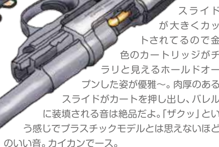
スライドが大きくカットされてるので金色のカートリッジがチラリと見えるホールオープンした姿が優雅〜。肉厚のあるスライドがカートを押出し、バレルに装填される音は絶品だよ。「ザクッ」という感じでプラスチックモデルとは思えないほどいい音。カイクンでース。