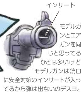
インサート モデルガンとエアガンを同じと思ってるひとは多いけど、モデルガンは銃口に安全対策のインサートが入ってるから弾は出ないの。スヨ。

ワルサー P.38 全長: 215mm 全高: 137mm 口径: 9mm 重量: 590g 装弾数: 8発